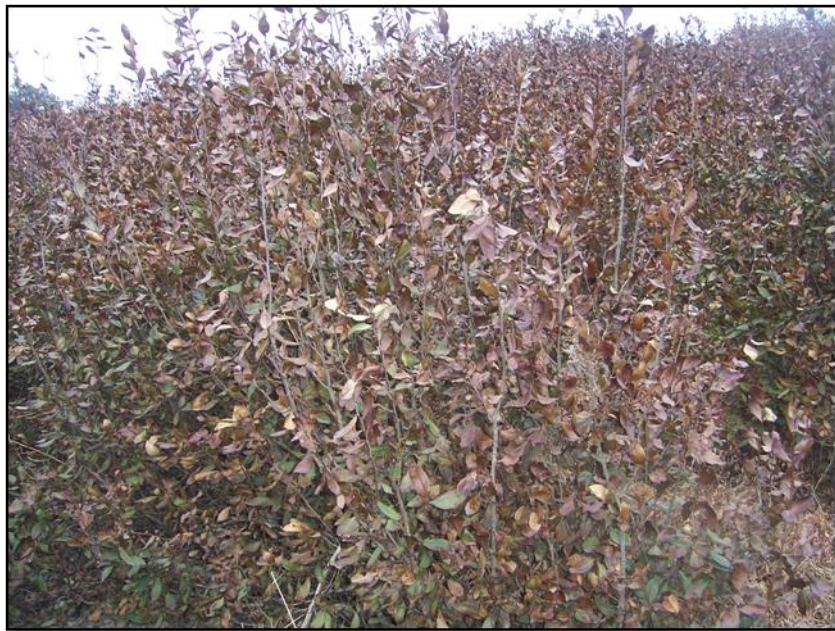
图B.4 茶树重度冻害代表性图