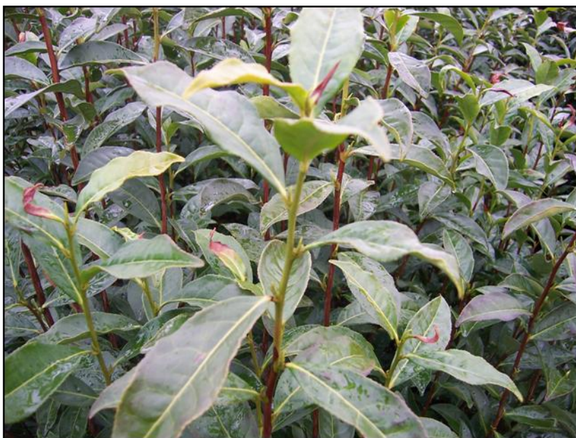
图B. 1 茶树轻度冻害代表性图