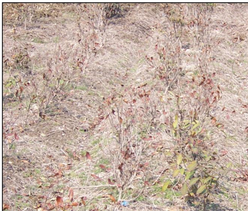
图B.5 茶树特重冻害代表性图