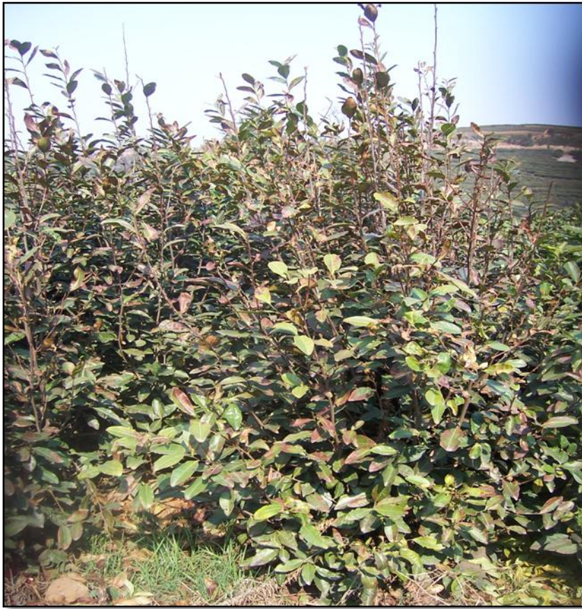
图B.3 茶树较重冻害代表性图